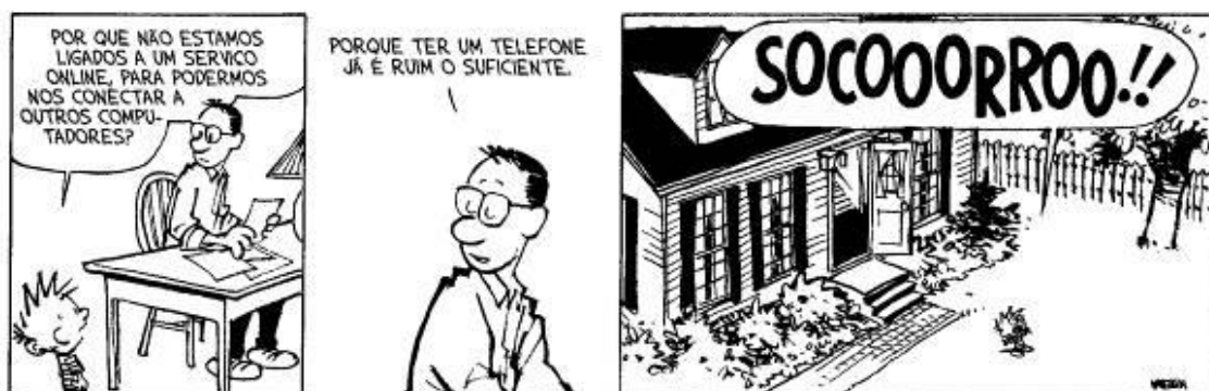
Figura 1: Calvin & Haroldo, de Bill Watterson, é um exemplo de tirinha

A tirinha é uma excelente forma de expressão no jornal e na revista. A mídia impressa precisou se diversificar e atender a diversos públicos, dando a possibilidade de o autor colocar suas vivências, experiências e problemas da vida cotidiana de forma divertida e provocativa, em uma realidade metaforizada, como no exemplo da tirinha abaixo, com os personagens Calvin e Haroldo, produzida por Bill Watterson: