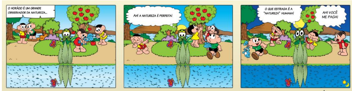
Figura 3: Tirinha do site Máquina de Quadrinhos, do usuário Sol & Lua

As grandes empresas produtoras de quadrinhos também não ficaram de fora. A Marvel lançou o site The Superhero Squad Show 13 onde qualquer um pode criar tirinhas utilizando os personagens da Marvel, como Homem de Ferro, Hulk, Wolverine, com feições infantilizadas. Já a DC Comics lançou uma divisão de quadrinhos on-line, a Zuda Comics. No site, os usuários podem votar em histórias feitas por artistas e fazer alguns comentários em relação a eles, estabelecendo um canal direto entre quem produz e quem consome. Neste caso, estamos falando da produção de quadrinhos em si e não especificamente da produção de tirinhas, mas o site é um embrião do que pode se tornar uma rede social de produtores de quadrinhos e uma boa janela para a exposição de produções amadoras, tanto de histórias em quadrinhos como de tirinhas.