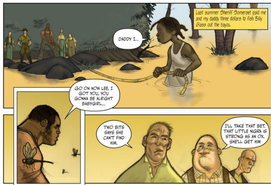
Figura 4: Bayou, de Jeremy Love, um dos quadrinhos publicados no site Zuda Comics e também um dos primeiros vencedores do concurso

As grandes empresas produtoras de quadrinhos também não ficaram de fora. A Marvel lançou o site The Superhero Squad Show 13 onde qualquer um pode criar tirinhas utilizando os personagens da Marvel, como Homem de Ferro, Hulk, Wolverine, com feições infantilizadas. Já a DC Comics lançou uma divisão de quadrinhos on-line, a Zuda Comics. No site, os usuários podem votar em histórias feitas por artistas e fazer alguns comentários em relação a eles, estabelecendo um canal direto entre quem produz e quem consome. Neste caso, estamos falando da produção de quadrinhos em si e não especificamente da produção de tirinhas, mas o site é um embrião do que pode se tornar uma rede social de produtores de quadrinhos e uma boa janela para a exposição de produções amadoras, tanto de histórias em quadrinhos como de tirinhas.