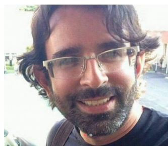
Balta, 37 Maguary UFRJ - Universidade Federal do Rio de Janeiro 1 km de distância