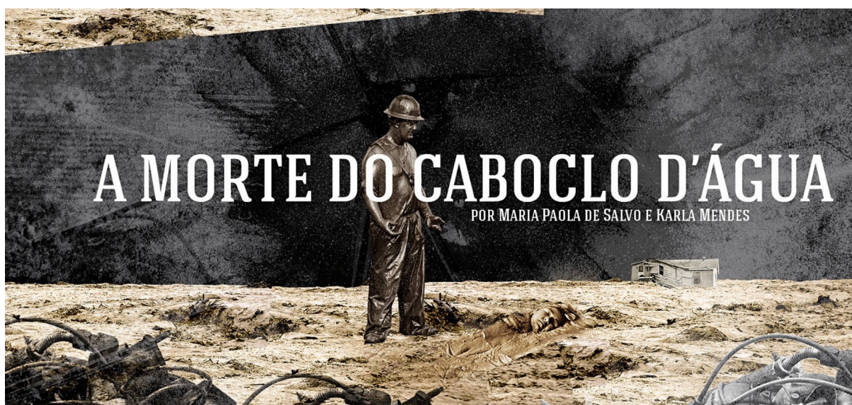
FIGURA 1 – Abertura da reportagem “A morte do Caboclo D’água”

Para além da reivindicação do status narrativo do jornalismo, apresentaremos uma análise de reportagem para explicitar os recursos narrativos que a grande reportagem jornalística, um dos gêneros mais nobres do campo, pode utilizar para tecer a história do presente – tanto em termos de estrutura como em termos de cuidadosos recursos de linguagem que aproximam a grande reportagem da arte. Para tanto, aplicamos o método da Análise Pragmática da Narrativa Jornalística (MOTTA, 2005) à primeira parte da reportagem “A Morte do Caboclo D’Água” 3 (figura 1), do site de jornalismo independente Brio, lançado em 2014 e já reconhecido e premiado em mais de uma ocasião. No Brio, chamam a atenção a qualidade dos textos, a fidelidade ao formato de jornalismo de longo formato (ou longform journalism ), a liberdade criativa dos repórteres e o desejo, explícito, de inovar na forma de contar histórias – no caso, a história da tragédia ambiental de Mariana (MG) após o rompimento da barragem da Samarco em novembro de 2015.