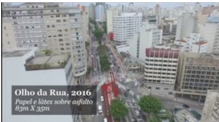
Fig. 11: Frame 10.