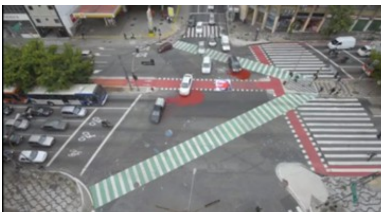
Fig. 9: Frame 8.

Nos frames 7 e 8, as câmeras se distanciam e mostram uma cidade confusa, com traços demarcados no chão, como uma flecha direcionando o olhar para longe. Coincidência ou não, o local onde aconteceu a gravação foi uns dos mais temidos na época da ditadura, onde ocorreu a chamada Batalha da Maria Antônia [nome dado ao confronto entre estudantes da Faculdade de Filosofia, Ciências e Letras da Universidade de São Paulo e da Universidade Presbiteriana Mackenzie], ocorrido em 3 de outubro de 1968. 15