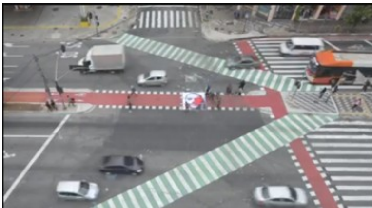
Fig. 8: Frame 7.

de repetição do lambe-lambe corrói a imagem individual, como um espelho da consciência coletiva.