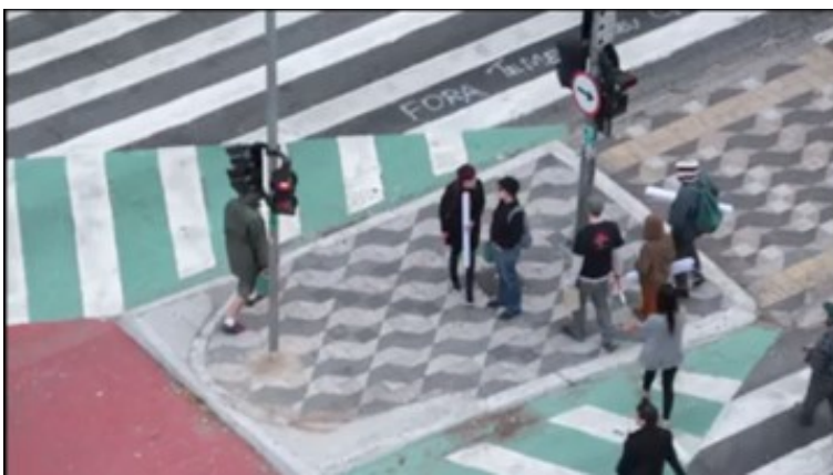
Fig. 3: Frame 2.

No início da produção videográfica, notamos que as pessoas do Grupo Olho da Rua não querem ser identificadas, usam blusas com capuz, escondendo o rosto. Entramos em contato com a Mídia Ninja para saber quem são os membros participantes desse grupo para lhes conceder créditos e perguntar como foi realizada a gravação ou o que os motivou a fazê-la, mas não obtivemos as informações, apenas nos responderam que o grupo Olho da Rua foi o responsável pela performance e gravação, eximindo-se de responsabilidade. Eis um trecho da conversa pelo Messenger da página do facebook da Mídia Ninja: “Esse vídeo não é nosso, sugerimos que entrem em contato com eles, o grupo que se identifica como OLHO da RUA, esse é o credito”.