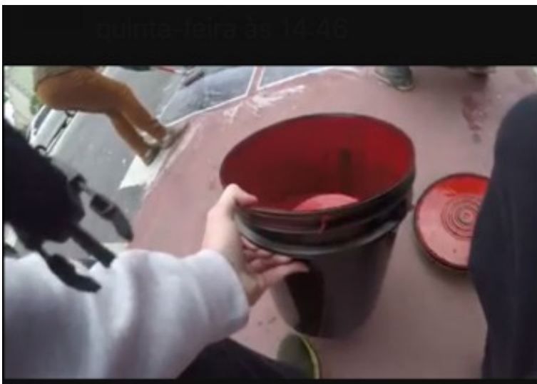
Fig. 6: Frame 5.