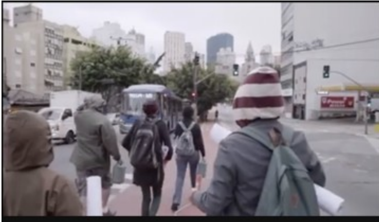
Fig. 2: Frame 1.