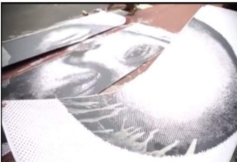
Fig. 7: Frame 6.

Nos frames 3, 4, 5 e 6, eles começam a colar no asfalto lambe-lambes digitais; técnica de grafite que tem o mesmo nome de uma técnica de fotografia utilizada nas primeiras duas décadas do século XX. Esta técnica é uma vertente da arte de rua que utiliza cartazes como intervenção urbana com intuitos que vão desde a simples transmissão de ideias e pensamentos à divulgação de protestos elaborados por meio de imagens e textos. No contexto dessa produção, contudo, os lambe-lambes têm mais a conotação dos anos 70 e 80 (remetendo à época da ditadura militar), utilizada tanto pela resistência como pela polícia, e na década de 80, onde eram feitas as propagandas de shows e do comércio local.