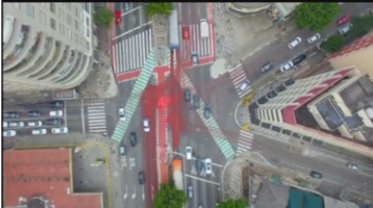
Fig. 10: Frame 9.