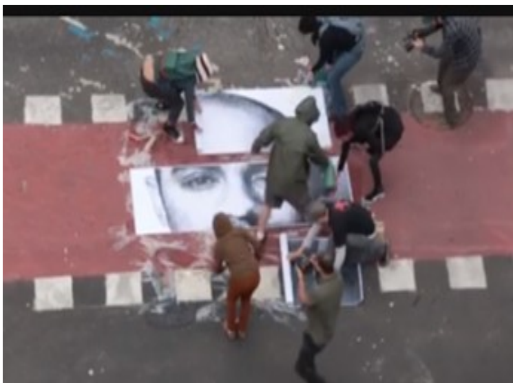
Fig. 5: Frame 4.