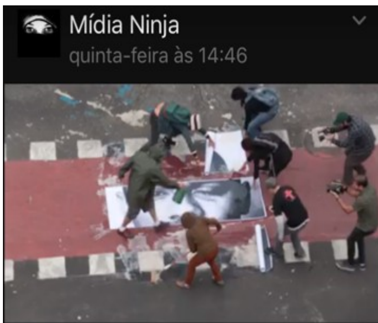
Fig. 4: Frame 3.

significado da imagem. Os capuzes sugerem uma referência aos Black Blocs , ao underground , pichadores, munidos de latas de tinta e rolos de pintar paredes.