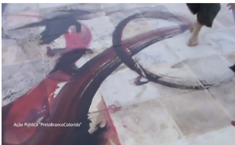
Fig. 16: Frame retirado do videoclip de registro do projeto P&B Colorido.

instrumentos, como vassouras e pincéis de grande porte, foram cuidadosamente posicionados pelos artistas em frente aos tapumes da construção. Feito isso, os mesmos caminharam pela areia até o mar munidos com baldes a fim de trazer uma grande quantidade de água salgada, que, assim como os instrumentos, também foram cuidadosamente posicionados em linha reta. Aos poucos alguns dos performers começam a se relacionar com os instrumentos, improvisando movimentos pelo espaço. Enquanto isso acontecia, outros artistas espalhavam no chão pequenos pontos de tinta vermelha e preta concentrada. Em um certo momento da ação, quando os performers já se movimentavam livremente pelo espaço, a tinta passou a ser diluída com a água salgada contida nos baldes. O que se viu a partir de então foi uma improvisação com os instrumentos, numa dança que aos poucos foi pintando toda a área, até que os rastros se transformassem em uma grande mancha escura e disforme. Quando o "mar de tinta" tomou conta da calçada, os artistas foram organicamente finalizando a performance, que permaneceu no chão do calçadão enquanto rastro-memória da ação. No dia seguinte, durante uma roda de conversa entre os colaboradores sobre o que havia acontecido, o bailarino Alex Ratton colocou que para ele “a ação aconteceu em forma de dança, pintura, arte e guerrilha.” 21