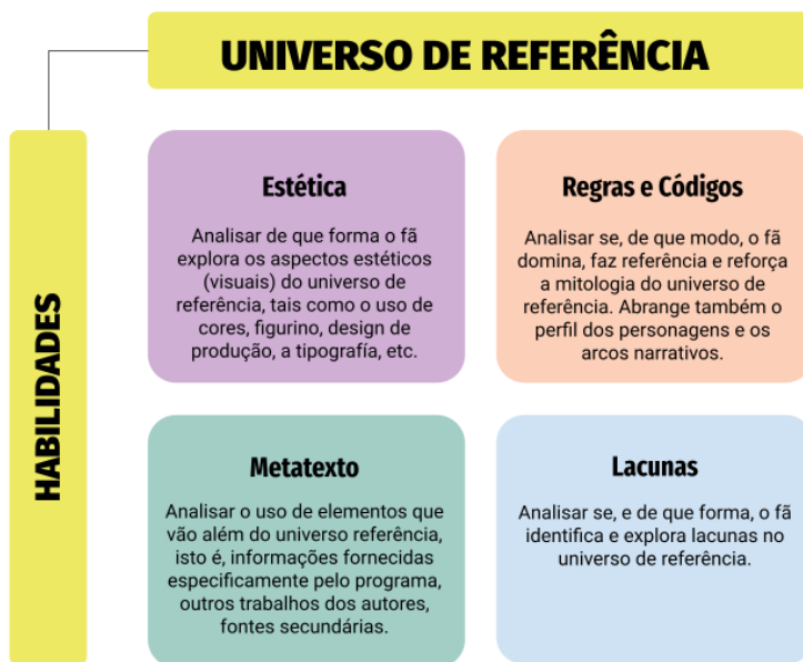
Figura 1: Habilidades do universo de referência.