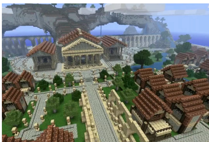
Ilustração 2 8

a explorar cavernas e minas subterrâneas, tentando coletar materiais para construir novos artefatos ou edifícios. As criaturas agressivas também ocupam os níveis subterrâneos, ou seja, minerar é uma atividade potencialmente lucrativa, mas também perigosa. Na Ilustração 1, vemos uma fortaleza construída inteiramente pelo jogador. O sistema de blocos do jogo funciona da seguinte maneira: você coleta inúmeros blocos feitos de diferentes materiais com suas ferramentas (machado, pá, picareta, etc.), e pode empilhá-los para erguer construções. No canto inferior direito está um segundo jogador: Minecraft pode abrigar mundos compartilhados através de servidores hospedados na internet.