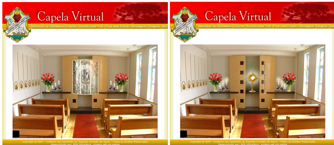
Figura 2 - Página do ritual "Adoração ao Santíssimo" do site das Apóstolas

Diante dessa tela, o fiel concede ao sistema a “permissão” de dirigir o seu olhar, em “adoração”, à hóstia. Dessa forma, o fiel conectado ao sistema olha para aquilo que este lhe permite ver – e totalmente a sós, como indicam os bancos vazios.