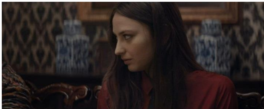
Figura 3- Parte do vídeo Facebook Home Dinner