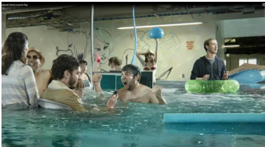
Figura 2 - Facebook Home Launch Day