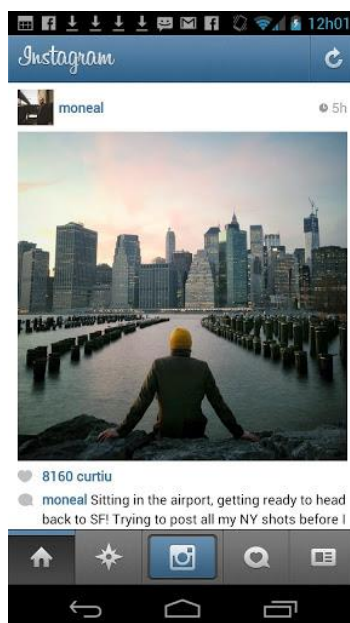
Figura 1- Tela do aplicativo Instagram no celular

O privativo, mesmo que tenha origem numa relação particular, pode ser mostrado porque tem possibilidade de cair na lógica da disponibilização como força da rede. Tudo pode ser mostrado desde que tenha como referência o valor espetacular que a sociabilidade midiática confere ao acontecimento. Além disto, o que foi postado pode ser replicado, aqui entra a natureza viral que quebra o valor de segredo ou privacidade entre pares ou grupos fechados e se abre numa perspectiva da própria sociabilidade, estar neste ambiente significa permitir e instigar a identificação e a identidade é aquela partilhada pela linguagem espetacular. E ainda, o que pode ser postado pode ser replicado. A cópia se instrumentaliza como linguagem espetacular, “contra o C” “contra o V”, disponível, válida por um estatuto cuja regra é a permissão para a visibilidade de todos.