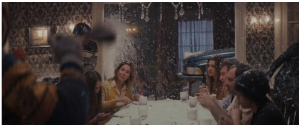
Figura 6 - Parte do vídeo Facebook Home Dinner