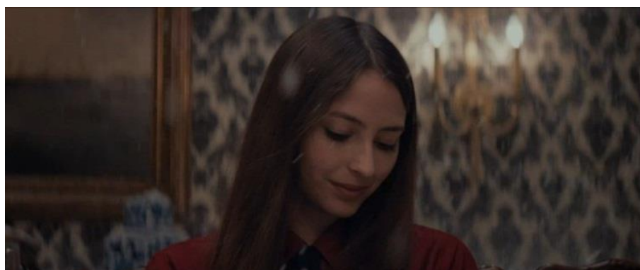
Figura 5 - Parte do vídeo Facebook Home Dinner