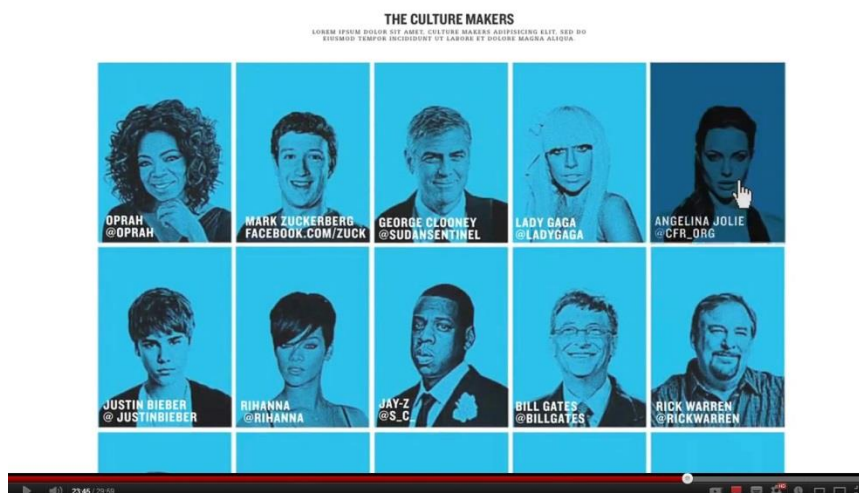
Figura 2: Uso da imagem de celebridades no vídeo Kony 2012