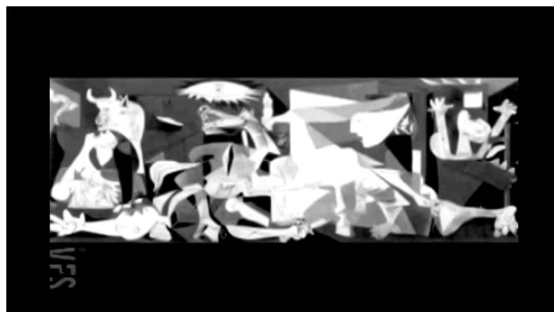
Fig. 13. Frame da animação Guernica (2003)