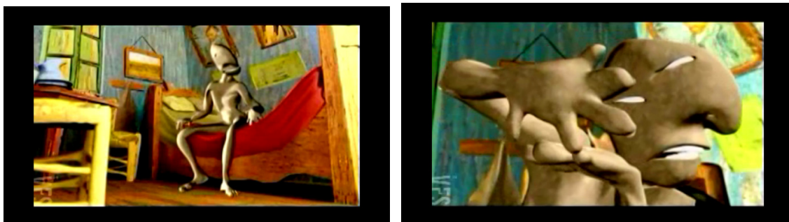
Fig. 5 e 6. Frames da animação “Guernica” (2003) – “Quarto em Arles” – Van Gogh

Antes da próxima cena/obra, o personagem faz expressões corporais que me leva a crer que novamente algo o incomoda, possivelmente um feixe de luz. Quando ocorre a transição para a próxima cena da animação, a obra “Persistência da Memória”(1931), de Salvador Dalí, a inquietação do ser acaba sendo entendida, pois a luz viria da próxima imagem, através das cores fortes características do estilo surrealista. O relógios derretidos, distorcidos do quadro de Dalí estabelecem as relações temporais e espaciais relativizadas na sequência a seguir. Continuando a caminhada, depois de passear pela obra, o personagem animado, na sua jornada, parece buscar entre as borboletas que se movem, uma saída, afinal nesse cenário surreal ele continua fora do seu tempo e espaço. Na cena em questão, o enquadramento usado na fotografia busca dar ênfase a esse detalhe, que nos leva a sugerir uma passagem de estado físico e espacial. O cenário surrealista colabora para criar um clima de incertezas, buscas e libertação. Na formação desta sequência, o recurso expressivo utilizado é a borboleta, como metáfora de transformação, de passagem para outra realidade, outra fase. O close na borboleta enfatiza o momento de passagem de cena, de metamorfose.