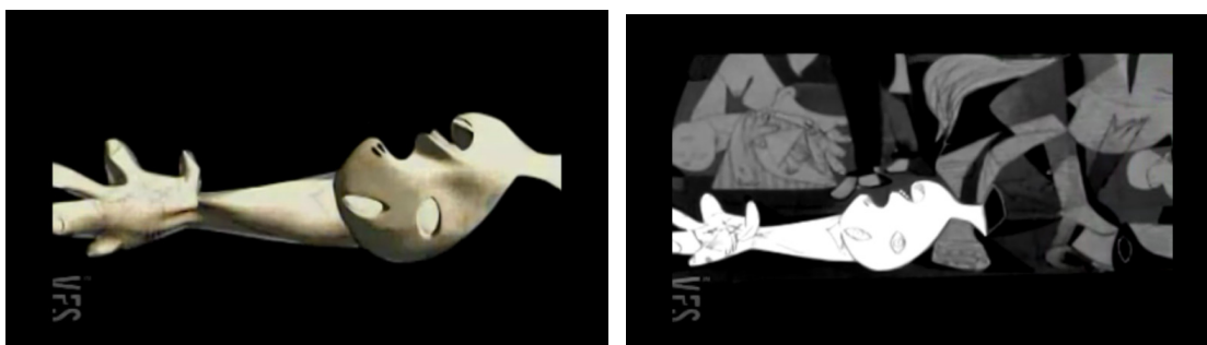
Fig. 11 e 12. Frames da animação Guernica (2003) – “Guernica” - Picasso

Não é o tipo de ferramenta que é essencial no discurso fílmico e o diferencia como propõe a perspectiva modernista, mas o modo pelo qual seu esquema técnico e sua instrumentalidade são inquiridos, manipulados e completados no e pelo exercício do fazer fílmico. (GRAÇA, 2006, p.44).