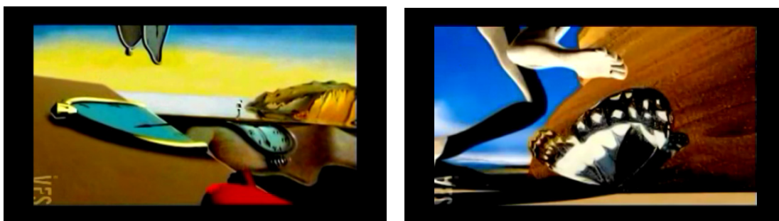
Fig. 7 e 8. Frames da animação “Guernica” (2003) – “Persistência da Memória” - Dalí

Antes da próxima cena/obra, o personagem faz expressões corporais que me leva a crer que novamente algo o incomoda, possivelmente um feixe de luz. Quando ocorre a transição para a próxima cena da animação, a obra “Persistência da Memória”(1931), de Salvador Dalí, a inquietação do ser acaba sendo entendida, pois a luz viria da próxima imagem, através das cores fortes características do estilo surrealista. O relógios derretidos, distorcidos do quadro de Dalí estabelecem as relações temporais e espaciais relativizadas na sequência a seguir. Continuando a caminhada, depois de passear pela obra, o personagem animado, na sua jornada, parece buscar entre as borboletas que se movem, uma saída, afinal nesse cenário surreal ele continua fora do seu tempo e espaço. Na cena em questão, o enquadramento usado na fotografia busca dar ênfase a esse detalhe, que nos leva a sugerir uma passagem de estado físico e espacial. O cenário surrealista colabora para criar um clima de incertezas, buscas e libertação. Na formação desta sequência, o recurso expressivo utilizado é a borboleta, como metáfora de transformação, de passagem para outra realidade, outra fase. O close na borboleta enfatiza o momento de passagem de cena, de metamorfose.