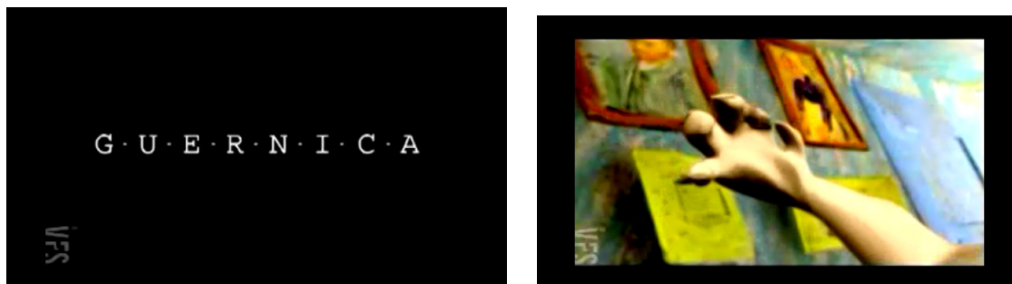
Fig. 3 e 4. Frames da abertura da animação “Guernica” (2003) – Vinheta de abertura 6

Na trajetória da narrativa o vídeo não apresenta diálogo, a sequência toda se passa com a expressão corporal do personagem protagonista, que é inspirado em um dos elementos da obra “Guernica”(1937). Remetendo às imagens dos quadros da vinheta inicial, a primeira cena se inicia no “Quarto em Arles”(1888), de Van Gogh, dando a impressão de ser uma extensão da abertura. A figura animada começa sua caminhada em busca do lugar de origem. As cores fortes e a luminosidade, características do pós-impressionismo de Van Gogh, parece incomodar o personagem que inicia uma viagem no tempo e nas formas dos elementos estéticos típicos de cada quadro, sem obedecer uma ordem cronológica pertencente a cada período. Sobre o movimento no filme animado Graça comenta: