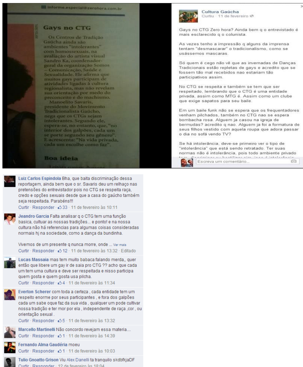
Figura 7- A postagem sobre a presença de gays no CTG.

A análise das postagens apresentaram alguns aspectos importantes. Um dos aspectos que chama a atenção é a repetição de comportamento que ocorre tanto nas relações reais 5 quanto nas virtuais. Esses comportamentos, como por exemplo, opinião, discussão, troca de ideias e defesa de ponto de vista e de valores, são repetidos e veiculados no meio virtual e no meio real, mas com a diferença do meio digital que oferece ferramentas para que as pessoas possam se comunicar dentro da comunidade.