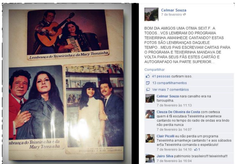
Figura 1 – Um membro da comunidade posta foto do cantor Teixeira e os usuários fazem comentários sobre a postagem.

Ao investigar o conteúdo da referida comunidade, percebe-se várias formas de representação acerca dos costumes e tradições por meio de imagens que retratam datas consideradas importantes na cultura gaúcha. A exemplo, aponta-se através da Figura 1, o banner alusivo ao programa do cantor Teixeira.