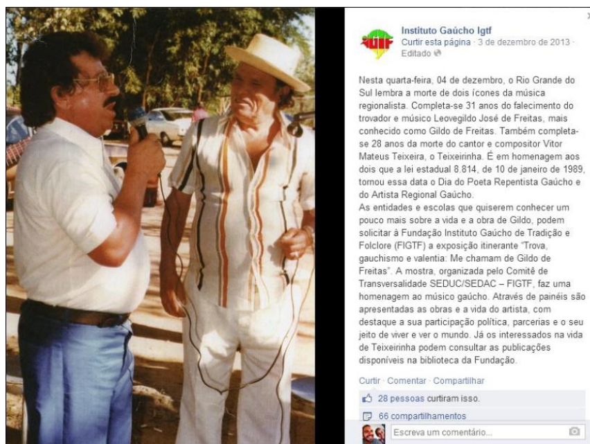
Figura 3 - Postagem sobre os 31 anos do falecimento de Gildo de Freitas.

A segunda postagem selecionada e analisada foi sobre Versos, ver Figura 4. O usuário da comunidade postou alguns versos juntamente com gravuras que ilustram os mesmos e outros usuários que se identificaram com o assunto fizeram comentários sobre o verso.