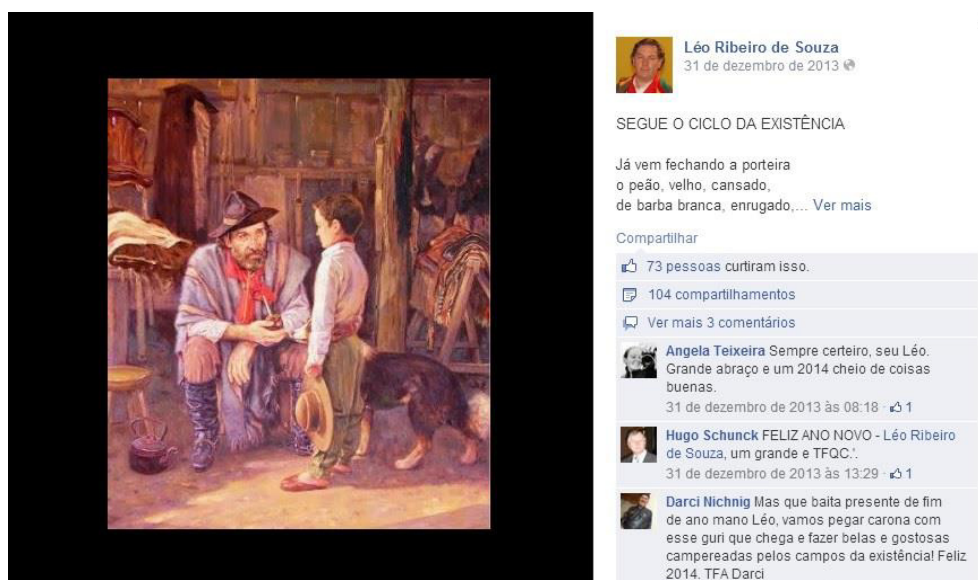
Figura 4- Postagem de versos gauchescos na comunidade

A segunda postagem selecionada e analisada foi sobre Versos, ver Figura 4. O usuário da comunidade postou alguns versos juntamente com gravuras que ilustram os mesmos e outros usuários que se identificaram com o assunto fizeram comentários sobre o verso.