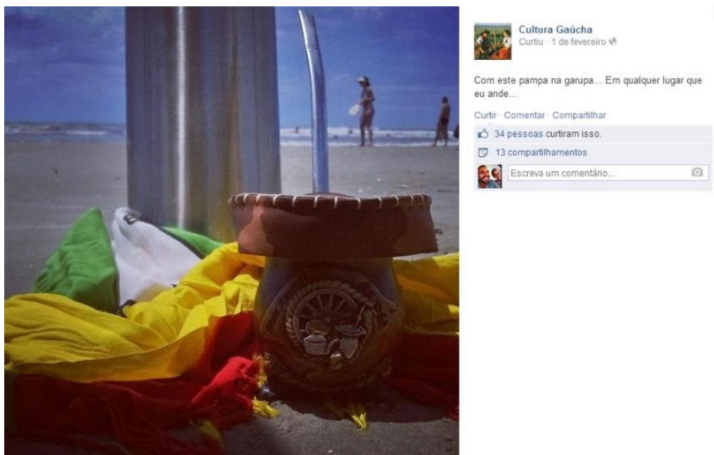
Figura 2 – Imagem que retrata o valor que o gaúcho dá ao chimarrão.

As diferentes formas com que os grupos humanos organizam a vida social, utilizam e transformam os elementos do meio ambiente, como percebem e manifestam suas relações com os objetos e com outras pessoas. Dito isso de outra forma, a cultura representa as variedades de modos de vida e seus processos de transformação envolvendo aspectos materiais e imateriais, palpáveis e impalpáveis de todas as concepções e práticas da vida social (NUMMER, 2008 apud ROSA, 2008).