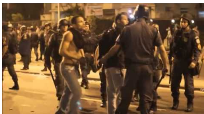
Figura 3. Fragmento do vídeo colaborativo que sugere a participação de policiais no lançamento de coquetel molotov contra a própria PM