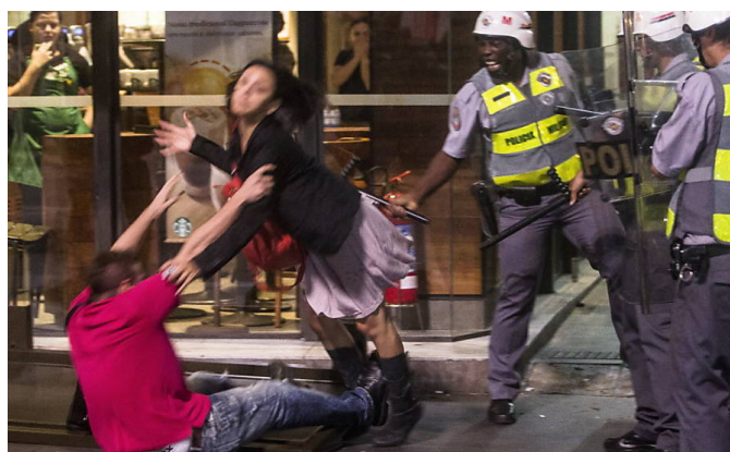
Figura 2. Policial agride casal, durante manifesto do dia 13 de junho de 2013, na avenida Paulista. (Imagem: Eduardo Anizelli/Folhapress)

Disponível em: < http://f.i.uol.com.br/fotografia/2013/06/13/287566-640x480-1.jpeg >. Acesso em 15 jul. 2014.