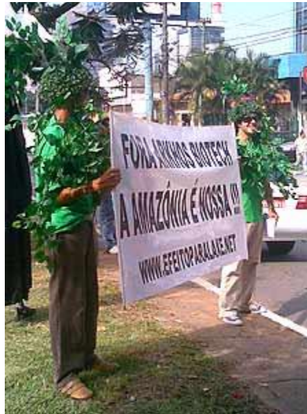
Ilustração 4: Personagens manifestantes durante a vinda de Bush ao Brasil, em 2007

Há o tempo diegético e o tempo ordinário, nos Alternate Reality Games. Contudo, como a narrativa se desenvolve no tempo e no espaço ordinários dos jogadores, o jogo deve se pautar a partir destes elementos, provocando uma fusão entre estes elementos ficcionais e reais. A vinda de Bush ao Brasil, ou a viralização de um vídeo ficcional cuja estética do real ultrapassou as fronteiras do fictício, o que levou muitos a acreditarem na veracidade da empresa, são elementos do tempo ordinário, do tempo casual que acontece no cotidiano. Ao serem apropriados como tempo diegético, equiparando-os como de uma mesma ordem, há uma permeabilidade das fronteiras que deveriam ser mais claras sobre o que é real e o que é ficcional. Ainda que os jogadores tenham isso bem definido em seu modus operandi , um não jogador, ao se encontrar com essas fusões temporais e espaciais, pode instaurar sua dúvida. Já os Treasure Hunts , por exemplo, permitem que a temporalidade diegética, mesmo que diferente da temporalidade cotidiana coincida e ou se distancie dependendo da proposta do jogo, contudo, estando a primeira sempre imbricada com a outra.