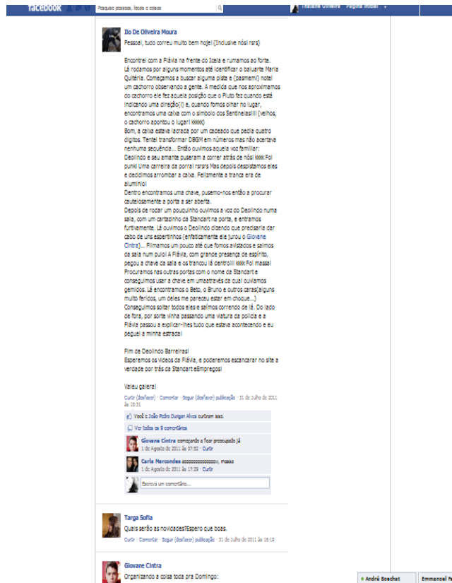
Ilustração 5 – diário de bordo escrito do Live-Action do ARG Capitães de Areia