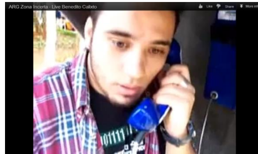
Ilustração 6 – registro audiovisual do ARG Zona Incerta