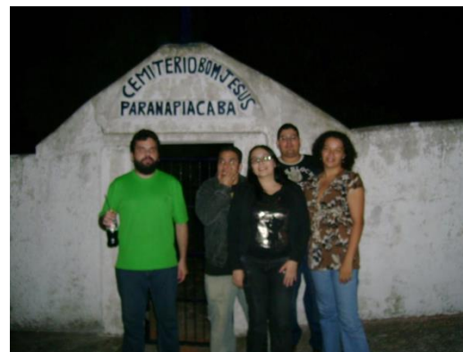
Ilustração 7 – documentação fotográfica do em Paranapiacaba - ARG Zona Incerta

A partir desta atuação, seja de si mesmo como nos Alternate Reality Games ou de personagens diversos e atemporais, o corpo do sujeito interator ganha uma outra função através da performance . Ele passa a não ser mais apenas o sujeito transeunte nos espaços reais. Ele passa a ser sujeito interagente dos espaços heterotópicos, sujeito agente das ações performática. Seu corpo não mais ocupa um espaço ordinário. Seu corpo também passa a produzir sentido nos espaços heterotópicos enquanto corpo material da diegese como parte ficcional dos jogos pervasivos. Tal acontecimento só é permitido, pois os espaços heterotópicos o permitem transbordar as fronteiras da ficcionalidade e da realidade, criar espaços outros em novas construções temporais, e permitir o vivenciamento de novas experiências em que o corpo presentifica no mundo, tornando o tempo tangível e o espaço solúvel.