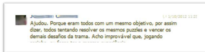
Ilustração 1: trecho da entrevista realizada com o jogador J.O., através do Facebook, no dia 01 de out. de 2012

Esta importância da coletividade em jogos pervasivo pôde ser percebida nas entrevistas realizadas com algumas jogadores deste gênero de jogo, através do Facebook, durante os meses de setembro e outubro de 2012. Questionados sobre a importância dos outros jogadores na jogabilidade individual deles no jogo, um dos jogadores respondeu que esta participação ajudou em sua experiência: