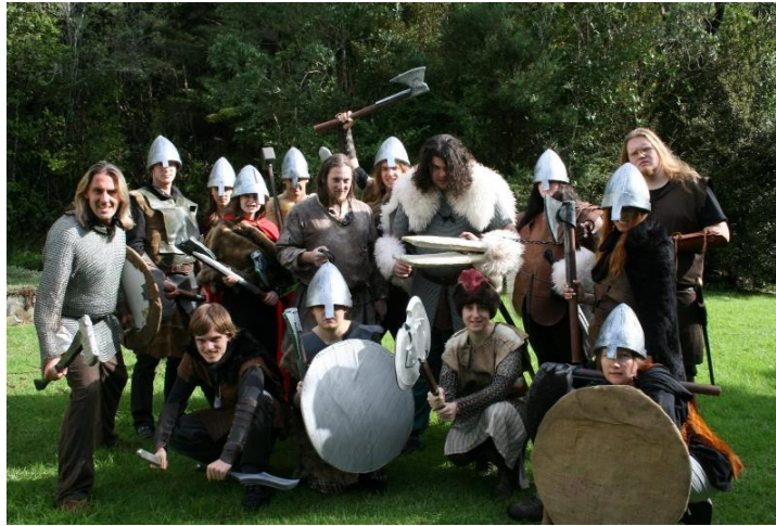
Ilustração 3: Larp medieval.

Já nos Alternate Reality Games (ARGs) a temporalidade funde-se com o ordinário a fim de causar o efeito de real esperado para o vivenciamento do TINAG. O Tinag, siga para This Is Not A Game (Isto não é um jogo) consiste em uma máxima deste gênero de produção que implica no fingimento de que o jogo não é um jogo a fim de vivenciar uma maximização da experiência e que permite o transbordamento das fronteiras da realidade e da ficcionalidade.