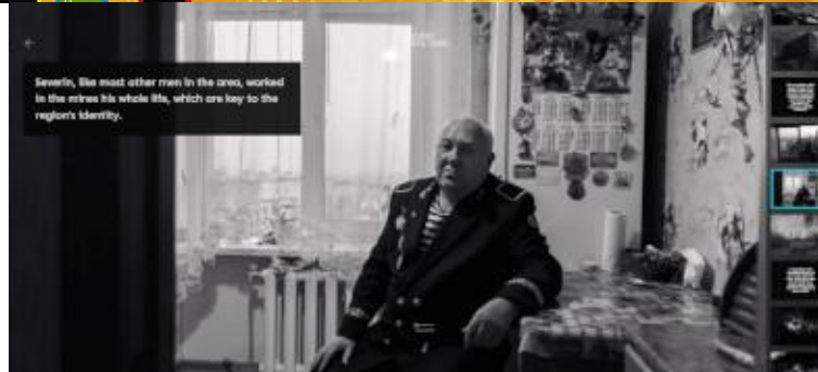
Figura 2: Uma das fotografias da primeira parte da reportagem, a qual apresenta histórias de pessoas que vivem na chamada zona cinza da Ucrânia.

Reconstructing seven days of protests in Minneapolis after George Floyd's death 11 (Reconstruindo sete dias de protestos em Minneapolis após a morte de George Floyd) fornece, por meio de elementos multimidiáticos e interativos, um quadro completo da primeira semana de protestos em Minneapolis, Estados Unidos, após o assassinato do homem negro George Floyd por um policial. A reportagem combina e mapeia 149 vídeos de transmissão ao vivo que, conforme a descrição fornecida pelos produtores, são conteúdos gerados por usuários das redes digitais “usados sem precedentes” pelos veículos jornalísticos.